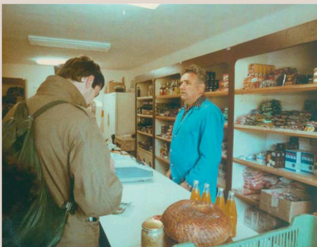
Obchod s potravinami na Horské Kvildě, kde nejen v 80. letech minulého století nakupovala celá Šumava.

S německými příbuznými se vídají dodnes. Honesovi jezdí do Německa, nebo vítají návštěvu na Horské Kvildě. „Už ale nemůžu jezdit na delší vzdálenosti a ty návštěvy jsou velmi vzácné,“ krčí rameny Eduard Hones.